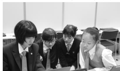
図3 グループでの相談風景

次の②「プレゼンテーションを実践的に行う」については、授業の中で完結する「授業のためのプレゼンテーション」ではない課題であったことと、「後輩の中学1年生」という明確なターゲットを設定した。