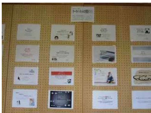
図3 廊下に掲示した標語ポスター

そして作成した標語・ポスターは授業終了後標語についてはIPA主催の「情報セキュリティに関する標語コンクール」に全員応募、ポスターについては生徒玄関に全員分掲示し、併設中学生への啓発を呼び掛けた。またこれらを作成時に明示することで、生徒のモチベーションを高めた。