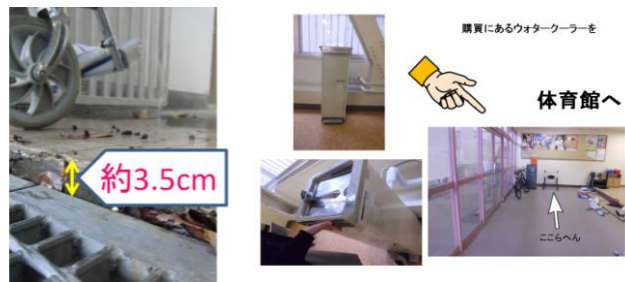
図4 生徒の問題指摘 (A5班)・図5 提案スライド (B1班)

6時間目にプレゼンテーション・相互評価・教員評価を行った。発表終了後、教員から各発表についての良い点・課題点について説明し、これをふまえて各自改善点と考察を書かせて提出をさせた。