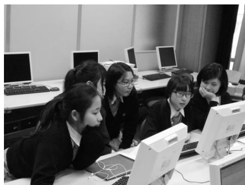
図6 グループワークの授業風景

今年度、付箋・KJ法・ブレインストーミングなどの手法を使った話し合いを繰り返す中で、全員が意見を出し、多くの意見からそれを整理し、最適な案を選択する場面が増え、「話し合い」の量・質ともに向上がみられた。