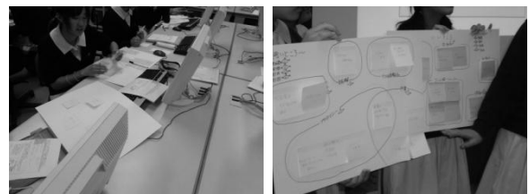
図1-2 生徒がKJ法で作成した用紙・風景 (2013)

1 時間目にインターネット上のコミュニケーションの特徴・変化について学んだあと、2 時間目の SNS の注意する点・便利な点について話し合う実習を行う。自分の経験からの意見だけでなく調べたことも付箋に記入させ、この付箋をもとに4人ずつのグループで、注意する点・便利な点を、KJ 法の手法で項目を整理し、まとめる。そしてまとめたものをクラスの中で1分程度で発表する。